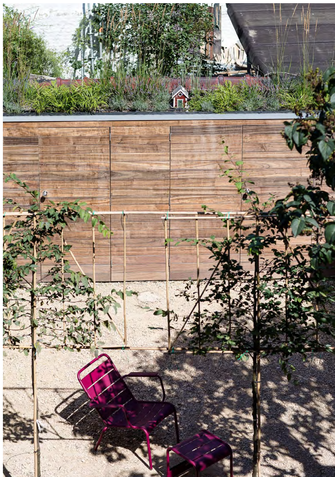
De hele dag biedt de tuin zonnige plekjes.