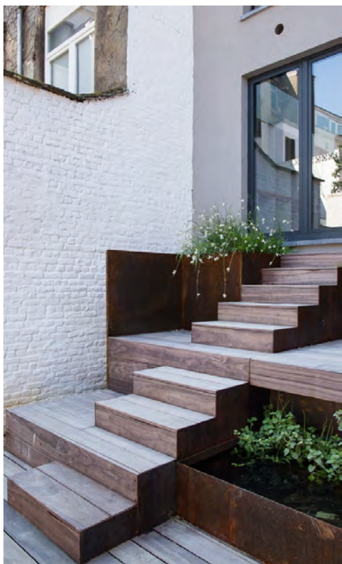
De trappen nodigen uit om erop te gaan zitten.

binnenuit.' De grootste uitdaging daarbij was het overbruggen van het niveauverschil van twee meter tussen de leefruimte en de tuin. 'Klassiek wordt zo iets opgelost door een terras aan te leggen ter hoogte van de leefruimte, van waaruit dan een trap naar beneden leidt. Maar zo'n terras met balustrade zou het vrije uitzicht hebben belemmerd.' Dus kwam het terras beneden in de tuin te liggen en werd het niveauverschil op een aantrekkelijke manier ingevuld. 'Om op een zachte manier de overgang te maken, hebben we een volumespel met vlakken bedacht. Er zijn treden waarop je kunt zitten, er is een klein terrasje en er staan plantenbakken in cortenstaal, met daarin wildere grassoorten die het strakke van de tuin een beetje breken. Met die plantenbakken creëren we ook een groengevoel aan de rand van het huis, ook al geeft dat niet rechtstreeks uit op tuin of terras', zegt Pieter-Jan.