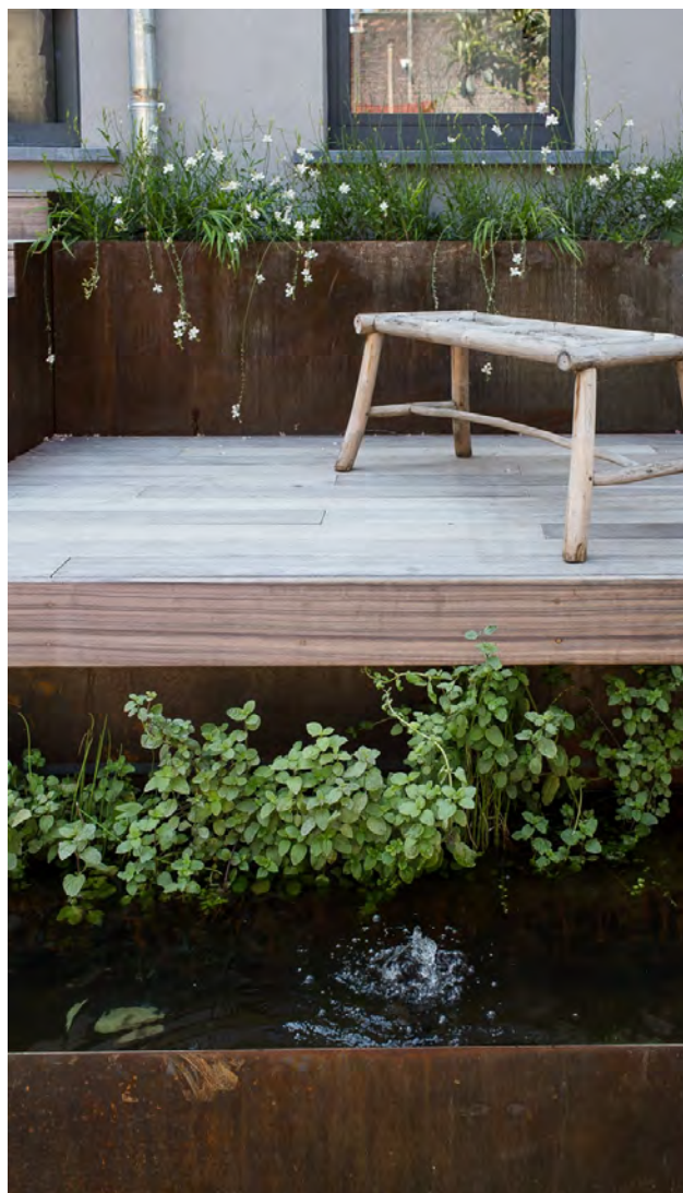
De viver met pompje dempt omgevingsgeluid.

binnenuit.' De grootste uitdaging daarbij was het overbruggen van het niveauverschil van twee meter tussen de leefruimte en de tuin. 'Klassiek wordt zo iets opgelost door een terras aan te leggen ter hoogte van de leefruimte, van waaruit dan een trap naar beneden leidt. Maar zo'n terras met balustrade zou het vrije uitzicht hebben belemmerd.' Dus kwam het terras beneden in de tuin te liggen en werd het niveauverschil op een aantrekkelijke manier ingevuld. 'Om op een zachte manier de overgang te maken, hebben we een volumespel met vlakken bedacht. Er zijn treden waarop je kunt zitten, er is een klein terrasje en er staan plantenbakken in cortenstaal, met daarin wildere grassoorten die het strakke van de tuin een beetje breken. Met die plantenbakken creëren we ook een groengevoel aan de rand van het huis, ook al geeft dat niet rechtstreeks uit op tuin of terras', zegt Pieter-Jan.