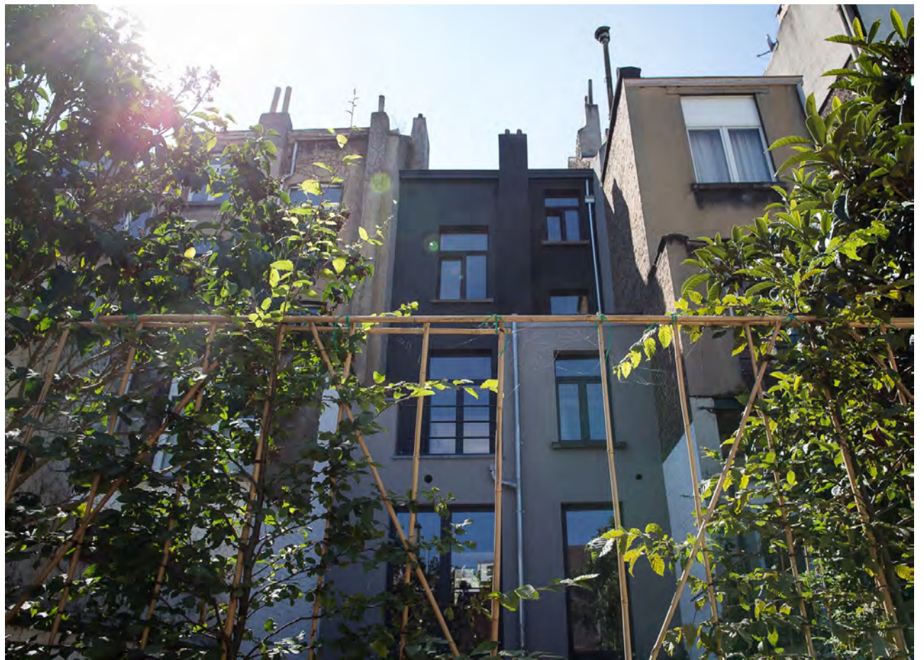
De bomen zullen op termijn helemaal dichtgroeien en een echte 'buitenkamer' vormen.